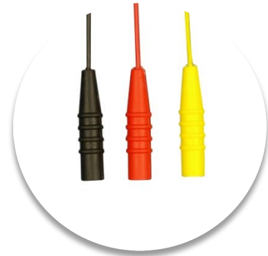
Douille 4 mm Longueur 0.60 m - Radiotransparente