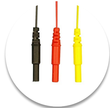
Fiche sécurité DIN 1,5 mm Longueur 0.60 m - Radiotransparente